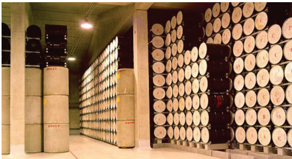
Slika 1. Dugoročno skladište NSRAO u mjestu Borssele, gdje se nalazi središte nizozemske organizacije za zbrinjavanje RAO Centrale Organisatie Voor Radioactief Afval (COVRA)

Strategija zbrinjavanja radioaktivnog otpada, iskorištenih izvora i istrošenog nuklearnog goriva RH preferira za NSRAO iz NE Krško površinski tip odlaganja.